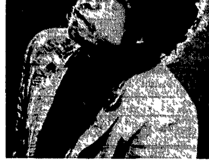
Il pianoforte più nuovo che è Venegono avanti i primi concerti d'autunno che hanno tutti questo di buono sono dedicati alla musica del nostro tempo.