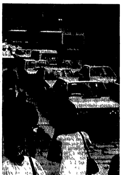
Il corteo di taxi nel centro di Bologna

Un lungo nastro giallo-taxi picchettato di blu (le auto dei noleggiatori) ha bloccato ieri mattina per due ore il traffico nel centro storico di Bologna. Attaccati ai cruscotti, simbonando per marciare meno che a passo d'uomo, quasi trecento tassisti hanno protestato così contro il Comune per essere stati esclusi dalla zona pedonalizzata.