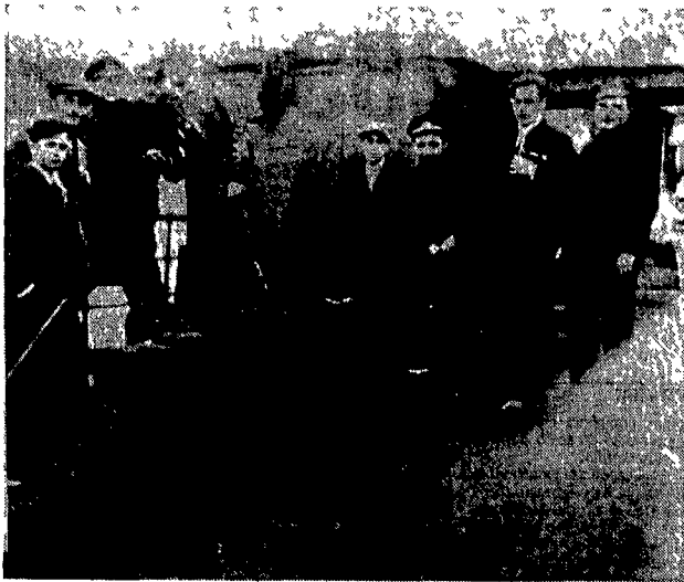
Ettore Majorana (al centro, col berretto) a bordo della nave sulla quale scomparve nel 1938

NAPOLI «Parlerò solo della fisica che Ettore Majorana ha fatto e che resta. Questo è l'importante». Che Edoardo Amaldi, oltre che un illustre scienziato, sia persona dal carattere fermo e determinato, è cosa nota. Così come è noto che il decano della nostra fisica (insieme a Gilberto Bernardini) tiene il metodo a conservare con scrupolo e con rigore intellettuale quel «patrimonio di scuola» che, sotto la guida di Corbino e di Fermi, si venne formando negli anni Venti a Roma, nel famoso Istituto di fisica di via Panisperna. Così, ieri mattina, all'apertura del 73° congresso della società italiana di fisica, che ha voluto ricordare Ettore Majorana (a 50 anni quasi, da quella sua scomparsa sul proscenio che da Palermo avrebbe dovuto riportarlo a Napoli, il mattino del 26 marzo del 1938), Edoardo Amaldi ha tenacemente rispettato la promessa Niente illazioni, su posizioni o l'ombra di un «caso Majorana». Meno che mai l'ipotesi di un ritiro in convento, di una crisi mistica o del ravvedimento di una coscienza inquietata al delinearci dello spettro atomico. E neppure un accenno a quella «spista argentina», avanzata più di recente. Niente di niente. Per più di un'ora Amaldi, che aveva il compito di ricostruire la figura scientifica di quel giovane intellettuale siciliano dall'«aspetto di un saraceno», che prediligeva Shakespeare e Pirandello, che aveva conqui-