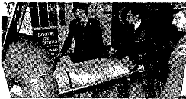
Il corpo di Uwe Barschel viene portato via dall'hotel «Beau Rivage»

misterioso informatore che, pare, era stato contattato dal fratello di Barschel che vive poco lontano, vicino a Losanna? Che cosa aveva da dire l'uomo politico democristiano al redattore dello «Stern» che aveva convocato al «Beau Rivage» e che l'ha trovato morto? Sono nuove domande per la commissione d'inchiesta che ieri ha aggiornato i suoi lavori fino a dopo le esequie di Barschel. Lunedì prossimo, davanti ai commissari, comparirà Reiner Pfeiffer, l'uomo che con le sue rivelazioni ha fatto scoppiare lo scandalo. Pfeiffer, già capo del suo ufficio stampa, accusa Barschel di averlo indotto a scrivere delle lettere anonime che dovevano provocare un'indagine per frode fiscale sul concorrente socialdemocratico alla presidenza dello Schleswig-Holstein Bjoern Engolm, nonché di avergli affidato l'incarico di segretario federale della Spd da un'agenzia di detective che avrebbero dovuto scoprire maga-