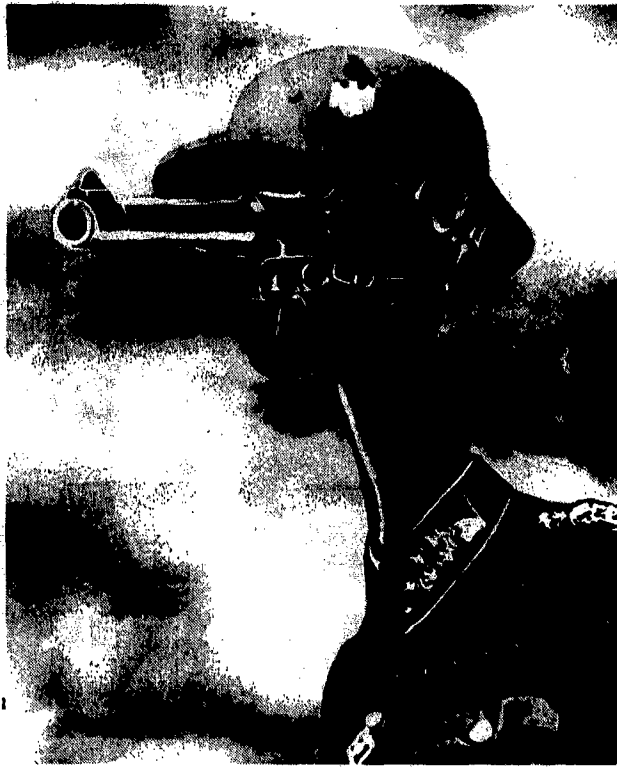
Un dirigente della MISAR S.p.A. mentre smentisce ufficialmente che le loro esportazioni abbiano a che vedere con il traffico di armi