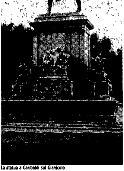
La statua a Garibaldi sul Gianicolo

restauro, del paesaggistico, dell'arredo urbano e che, di conseguenza, richiederà tempi lunghi ed una salda alleanza tra tecnici e professionisti.