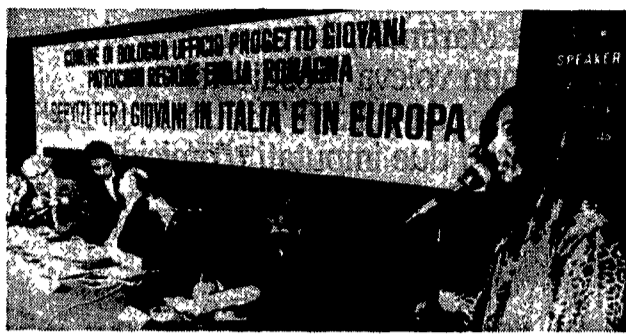
Un'immagine del movimentato convegno di Bologna

BOLOGNA. «Sembra un Lotta Continua del '77, direte voi. Eccezzaccio, le menate rimangono sempre le stesse...», legge il leader del punk.