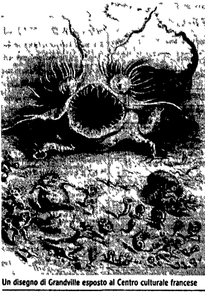
Un disegno di Grandville esposto al Centro culturale francese

Si inaugura oggi alle 18, al Centro culturale francese in piazza Navona 62 la mostra «J.J. Grandville (1803-1847) Disegnatore romantico e fantastico» Grandville (il suo vero nome era Jean Ignace Godefroid) fu un caricaturista polacco, contemporaneo di Daubier e illustratore di libri. I suoi disegni fanno pensare a cartoni animati, illustri antenati dei cartoni del Novecento e di Walt Disney. La mostra contiene 150 fra disegni, litografie, incisioni scelti per offrire una carrellata esauriva dell'opera dello spiritoso disegnatore dell'800, ed è completata da un video che presenta la serie dei disegni originali delle favole di La Fontaine. La mostra rimarrà aperta fino al 28 novembre. Per tutti i giorni esclusi la domenica e i festivi, dalle 16.30 alle 20. □ RB