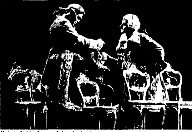
Umberto Orsini e Giuseppe Cederna in «Amadeus»