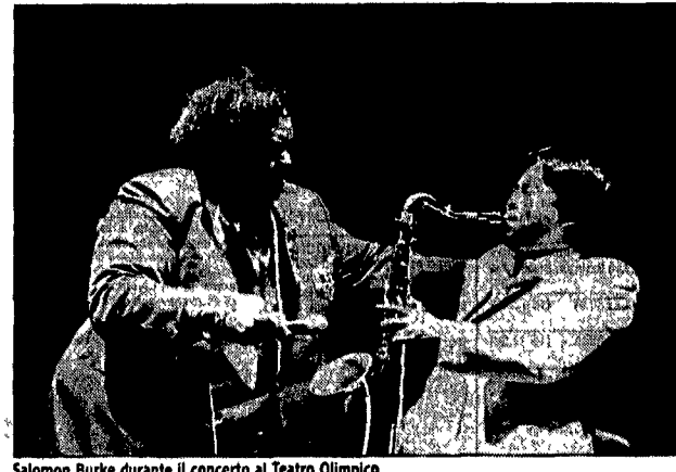
Salomon Burke durante il concerto al Teatro Olimpico

Ancora una volta l'errabonda «Alice» rischia di perdere casa? Il collettivo «Alice nella città» sembra avere la sfortuna di ricordare ai proprietari l'esistenza di stabili