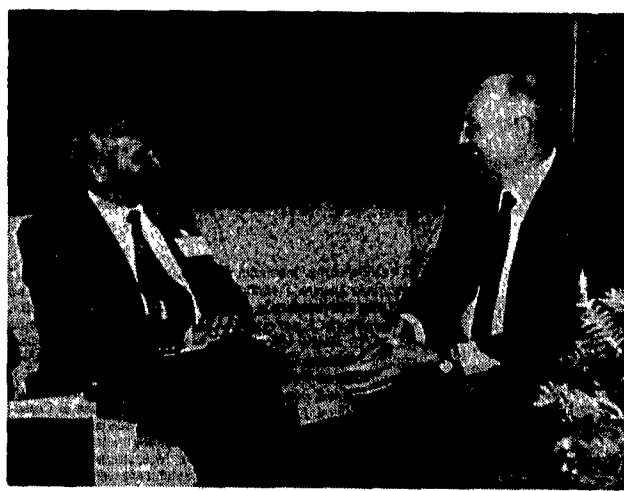
L'incontro a Mosca tra Mikhail Gorbaciov e Alessandro Natta