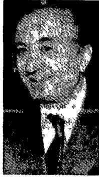
Ciriaco De Mita