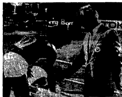
Il giudice misterioso ed Evangelisti dopo il salto

che hanno permesso un'oggettiva comparazione. Dal filmato emerge nettamente un altro dettaglio. Si vede distintamente dopo il sesto e ultimo salto di Evangelisti un giudice (capelli bianchi, 50-55 anni, giacca grigia) avvicinarsi all'atleta prendendogli un braccio e sussurrargli qualcosa. Dopo il rapido colloquio Evangelisti si volta a guardare il tabellone elettronico ed esulta. Chi è l'uomo in questione? Che cosa ha detto? All'antepagina televisiva erano stati invitati sia il presidente federale Nebiolo che l'azzurro Evangelisti. Hanno entrambi declinato l'invito. Curiosa la motivazione dell'atleta: «Io salto, non sono un misuratore». Evangelisti, polemiche ed