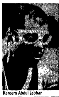
Kareem Abdul Jabbar

Jabbar insiste Il gigante a 40 anni è ancora il n. 1