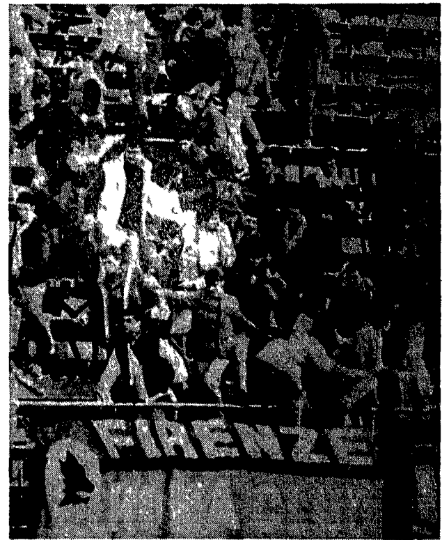
Domenica violenta su molti campi. Qui vediamo teppisti in azione ad Empoli