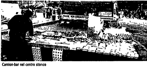
Camion-bar nel centro storico