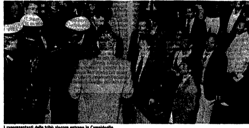
I rappresentanti delle tribù zingare entrano in Campidoglio