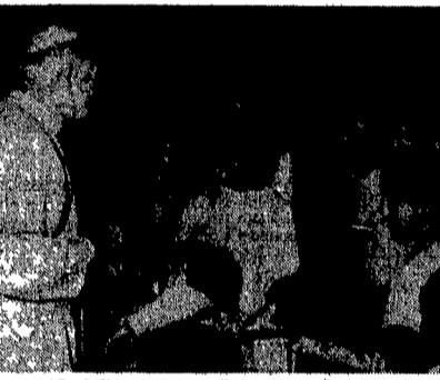
Giovanni Paolo II con un gruppo di piccoli nomadi durante l'udien- za generale del mercoledì

Comune di Roma, che riporta- va le parole pronunciate poco prima durante il Consiglio co-