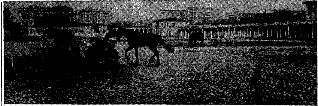
L'ampia spianata dell'ex Mattatoio al Testaccio

«Signor commissario, la casa mi serve, ho il figlio che si sposa tra una settimana e l'affittuario non vuol lasciarla, e neanche paga più l'affitto». Con questa cantilena, camuffata da piccoli proprietari di case con la necessità urgente di riavere i loro appartamenti, decine di persone si sono messe in fila negli uffici del commissariato.