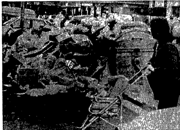
Cumul di immondizia in via Diego Angeli, sulla Tiburtina

Stamane la città sarà ricoperta da una coltre di oltre diecimila tonnellate di rifiuti. Stasera, dopo la raccolta, ne resteranno otto-novemila. Il blocco degli straordinari ad oltranza, proclamato dai netturbini, prosegue.