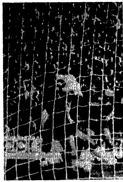
Cerezo (semicoperto nella foto) segna col tocco il pareggio

casa convinti e autoconvinti che tutto sommato non è andata male» non può ingannare.