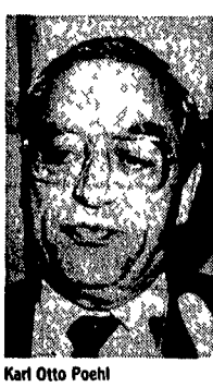
Karl Otto Poehl

Le perplessità circa la possibilità che la Germania e Giappone siano le locomotive che strapperanno l'economia mondiale alla recessione sembrano prendere piede anche negli Stati Uniti.