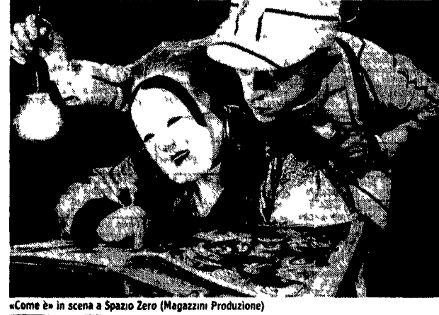
«Come è» in scena a Spazio Zero (Magazzini Produzione)

Bosco di David Mamet Regia di Marco Parodi. Da mercoledì al Teatro Spazio Uno vicolo dei Panien 3. Favola metropolitana, trasportata tra i boschi, dell'autore americano più quotato del momento (autore, tra l'altro, del bel film «La casa dei giochi», sua prima esperienza cinematografica). La lettera di mamma di Peppino De Filippo Regia di Luigi De Filippo. Da giovedì fino al 6 gennaio al Teatro delle Arti via Sicilia 59. Questa farsa in due tempi re-se celebri i due fratelli De Filippo che nel lontano '33, impersonarono due nobili scontenti che cercano di sistemarsi sposando due ric-