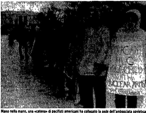
Mano nella mano, una «catena» di pacifisti americani ha collegato la sede dell'ambasciata sovietica a Washington con la Casa Bianca, visibile sullo sfondo