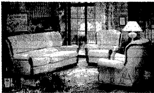
Di gusto barocco, costituito da una struttura portante in legno massiccio scuro, valorizzato dalle ricchezze del particolare, della finitura. 1.230.000,00 (GARANZIA COMPRESA)