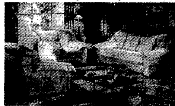
Salotto tutto morbido di un'immagine accogliente il salotto è composto da un divano 3 posti e 2 poltrone. 990.000,00 (GARANZIA COMPRESA)