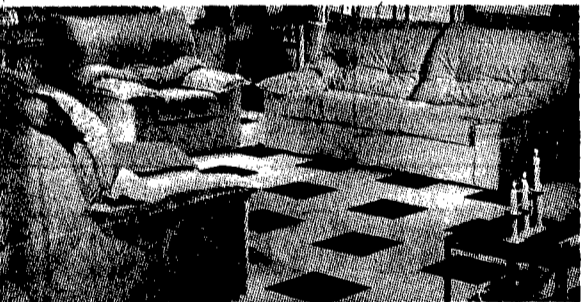
SALOTTO COMPLETO 890.000,00 (GARANZIA COMPRESA)