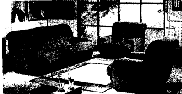
SALOTTO COMPLETO 460.000,00 (GARANZIA COMPRESA)