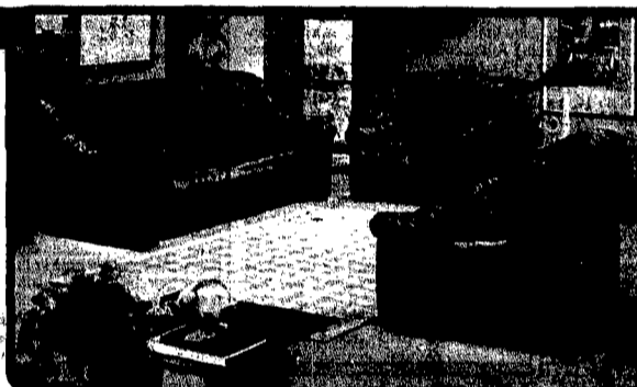
Salotto tutto morbido di un'immagine accogliente caratterizzato da una sagomatura avvolgente. Il salotto è composto da un divano 3 posti e 2 poltrone. 990.000,00 (GARANZIA COMPRESA)