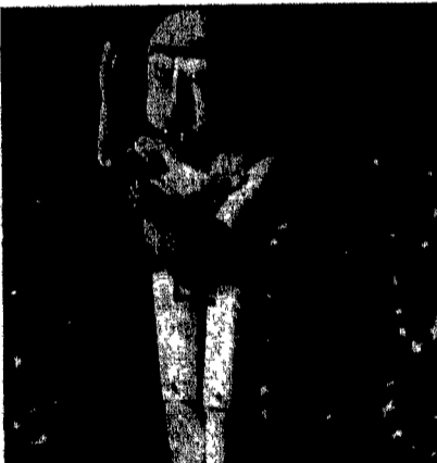
Una marionetta del «Piccolo principe»