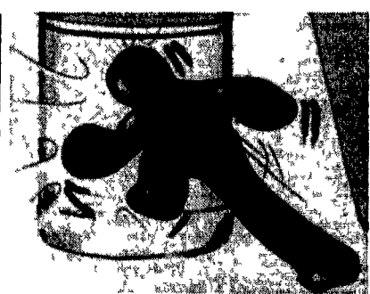
Un noto spot pubblicitario televisivo

«più audience non significa qualità». Speriamo che lo creda davvero. In compenso per il suo Festival speciale ci proponiamo scenografie (di Zuckowsky) ispirate ai quadri dell'Arcibaldo, sfilate di moda (con l'immane Trussardi) ispirate alle quattro stagioni pellicce dalla Russia abiti botticelliani per la primavera e Brigitte Nielsen che torna nei suoi panni (accompagnata da numerose colleghe).