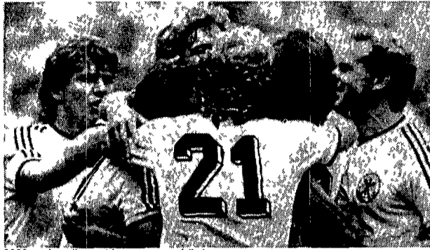
1988: anche sullo sport la concorrenza delle tv