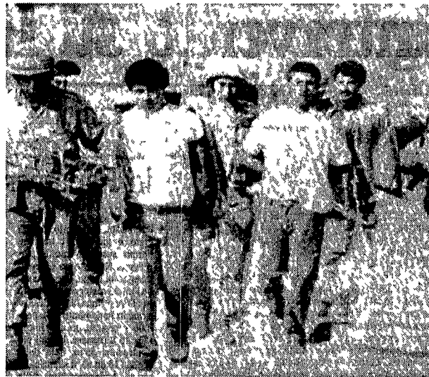
Soldati israeliani arrestano dimostranti palestinesi in un campo della Cisgiordania