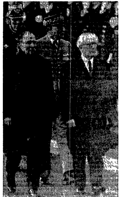
L'arrivo di Honecker all'aeroporto parigino di Orly