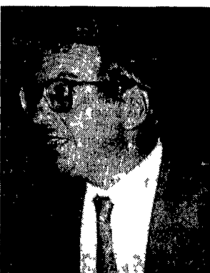
Giorgio La Malfa