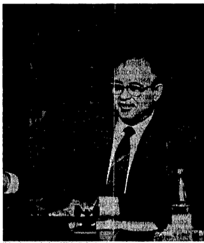
Il leader sovietico Mikhail Gorbaciov