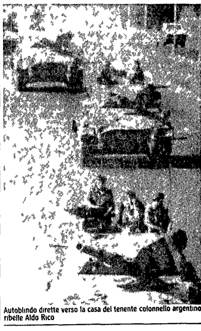
Autobluindo diretto verso la casa del tenente colonnello argentino ribelle Aldo Rico