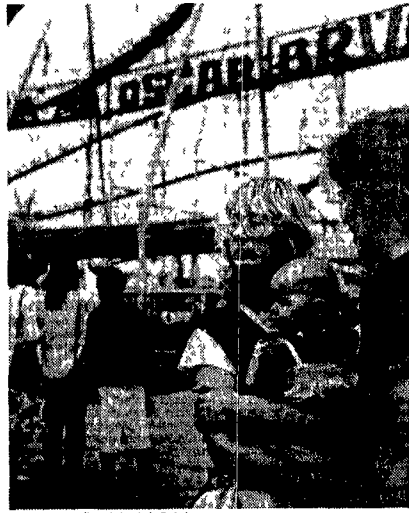
Una fotografia di André Gelpke