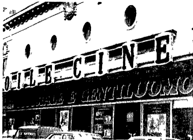
L'Etoile, uno dei cinema della protesta

che si sono fatti avanti: Berlusconi Parretti e l'Istituto Lucre - offre solo l'80 per cento della gestione. Dal pacchetto l'Acqua Marcia vuole tenere fuori quattro sale quelle più redditizie nella forte catena cittadina. Adriano Arston Arston 2 Etoile. Su queste cerca di realizzare gli affari migliori. L'Arston e l'Adriano vuole giocare con il Comune che ci ha puntato gli occhi per il futuro Auditorium. Forse si aspetta in cambio proprio dal Comune di avere mano libera per poter ristrutturare a suo piacere e profittare le altre due sale. I progetti per l'Arston 2 e l'Etoile sarebbe di guerra sono scesi i lavoratori. Nella tempesta che agita la Mondialcine sindacati e con-