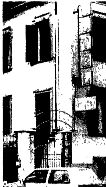
L'hotel Brighton a via Giolitti

Il 1988 sarà per la provincia romana un anno interamente dedicato al mare. L'iniziativa è partita da palazzo Valentini dall'amministrazione provinciale. Ieri l'assessore all'Ambiente Athos De Luca ha annunciato in una conferenza stampa tenuta a bordo di un barcone sul Tevere «L'isola del sole». E per l'anno del mare la Provincia sta preparando una serie di iniziative tese a salvaguardare le coste romane una campagna contro lo scarico di rifiuti e il recupero ambientale del litorale. L'allestimento di barriere contro le reti a strascico e l'organizzazione della vigilanza volontaria. Inoltre sarà anche istituita una commissione che avrà l'incarico di stendere la mappa delle specie ittiche presenti nel mare vicino Roma. All'iniziativa ha partecipato anche il ministro della Marina mercantile Prandini.