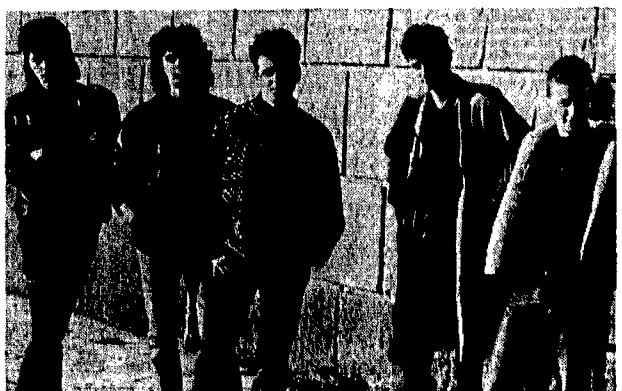
Il gruppo rock «Fasten Belt» stasera in concerto al Piper

denza. Compresi, naturalmente, i fumetti. E qui che Pablo Echaurren ha fatto la prima mostra. E qui anche una mostra piena di implicazioni interessanti. Una mostra a tema (l'ora, o l'orologio d'artista) che affiancava pittori, grafici, architetti e poeti visivi. Mostra esemplare di quel sovraccarico d'immagine che il «Museo stampato» produce, esemplare per tendenza al «messaggio» d'immagine e alla moltiplicazione (infinita) che gli infiniti libri/cataloghi stanno (positivamente?) provocando. E il pubblico? Ci chiariscono: «Il pubblico è misto, riarante della zona Pantheon (ne dis- sia infatti 200 metri) con il suo passaggio di tempo libero, ma molte sono le persone addette ai lavori (grafici, creativi)». E molti (e questo è il dato nuovo) sono semplicemente pubblico «colto» (visivamente), attirato e sedotto dalle nuove e intrecciate strategie dell'immagine.