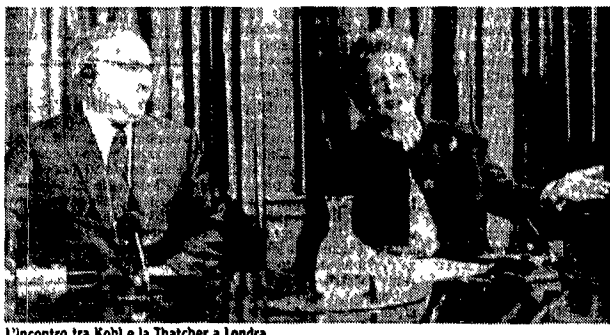
L'incontro tra Kohl e la Thatcher a Londra