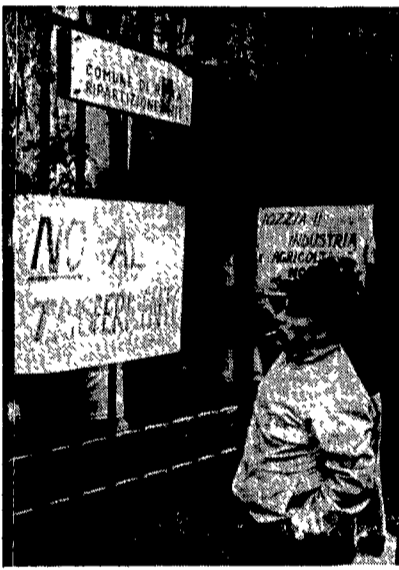
La XIII ripartizione occupata

ve della città, quest'assenza di direzione politica ha effetti nefasti. Ma non è il solo segnale da cui si capisca che per la giunta Signorello la XIII Ripartizione è una sorta di «Cenerentola».