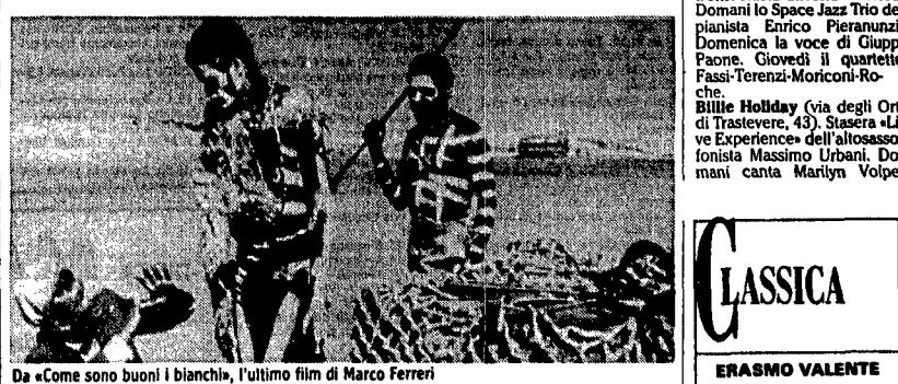
Da «Come sono buoni i bianchi», l'ultimo film di Marco Ferreri

Domenica, ore 17.30, Jam Session. Giovedì sera con il quartetto «The Blue Brass Connection» tra gli altri Leon Thomas (voce), Oliver Lake (sax alto), David Murray (sax tenore), Hamiet Bluiett (sax basso).