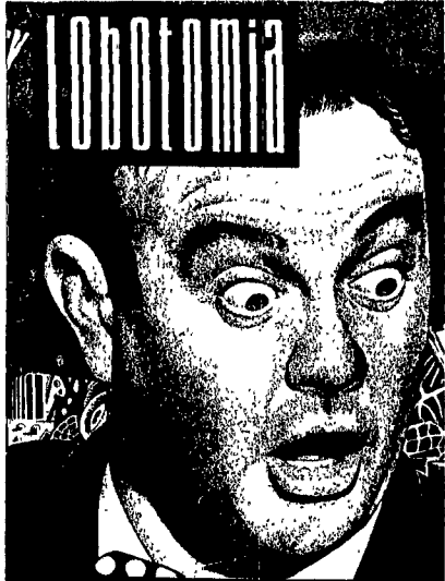
La copertina della rivista «Lobotomia»

È una sera fredda, opaca. Tirato su il bavero del cappottone color nocciola mi avvio per le strade già quasi deserte di San Lorenzo. Ho un biglietto in tasca. Lo leggo ancora una volta: «Rive Gauche, via dei Sabelli 43. Vieni ti aspetto. R.».