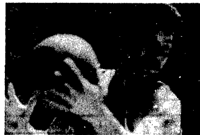
Meo Sacchetti della Divarese