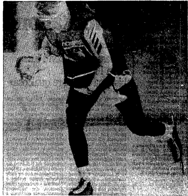
Madre e figlio si preparano alla parate di stelle di Calgary. In alto, il simbolo delle Olimpiadi