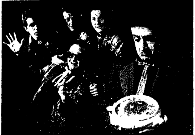
Il gruppo fiorentino «Dennis and the Jets» in concerto al Big Mama