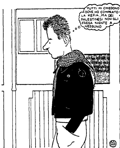
Un disegno di Marco Petrella