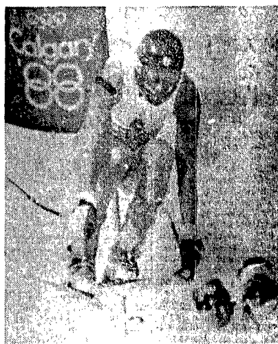
Pirmin Zurbriggen: sarà ancora il numero 1?