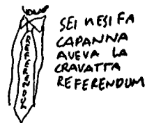
SEI MESI FA CAPANNA AVEVA LA CRAVATTA REFERENDUM DP È UN PARTITO MILANESE LA MILANO DELLA MODA

LA CHIESA È PER IL CONTROLLO DELLE NASCITE??