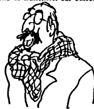
RUSSO SPENA DP CON LA KEIFA PALESTINESE

quali provvedimenti urgenti intenda prendere a salvaguardia della salute e delle condizioni di vita dei cittadini e dei lavoratori interessati! (4-04429)