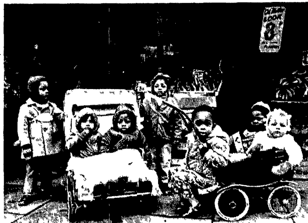
I fratelli Jackson in una foto risalente a dodici anni fa. Michael è l'ultimo a destra. Da notare che sin da bambino si schiariva la pelle stregandosiela con polvere di marmo

COME SI CHIAMA LA CAPITALE DEL BELGIO? OLIVETTI E BRUXELLES AUORA? È LA CAPITALE DI CHE? DEI CAVOLETTI, NO? BDA