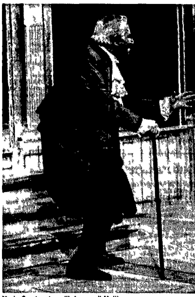
Mario Carotenuto nell'«Avaro» di Molière