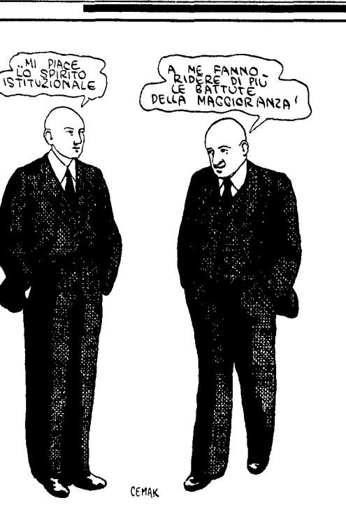
CEMA... A MI PIACE LO SPIRITO ISTITUZIONALE... A ME FANNO RIDERE DI PIU' LE BATUTE DELLA MAGGIORANZA'

Caro direttore, sono stato prigioniero di guerra dei tedeschi nel Lager «XVII A»... Sono stato prigioniero di guerra dei tedeschi nel Lager «XVII A» situato nelle foreste di Kaiserstentbrak, e ne ho vissuto le atrocità.