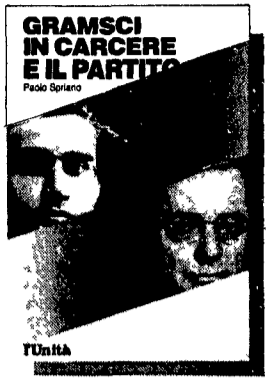
GRAMSCI IN CARCERE E IL PARTITO

Oggi con il giornale il libro «Gramsci in carcere e il partito»