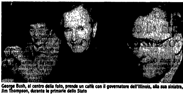
George Bush, al centro della foto, prende un caffè con il governatore dell'Illinois, alla sua sinistra, Jim Thompson, durante le primarie dello Stato