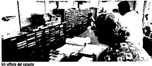
Un ufficio del catasto