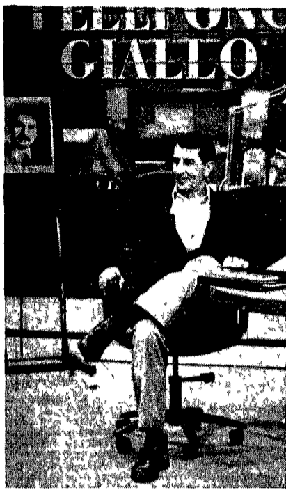
Corrado Augias torna in tv col suo «Telefono giallo»