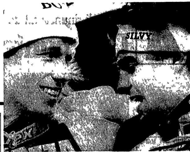
Alberto Tomba (a destra) e Pirmin Zurbriggen grandi protagonisti della Coppa del Mondo di sci