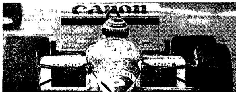
Nelson Piquet al volante della Williams