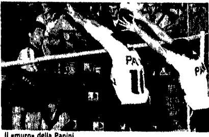
Il muro della Panini