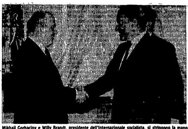
Mikhail Gorbaciov e Willy Brandt, presidente dell'Internazionale socialista, si stringono la mano durante i colloqui al Cremlino.

MOSCA. «Come ho trovato Gorbaciov? Molto tranquillo, deciso, determinato. Una grande impressione di sicurezza».