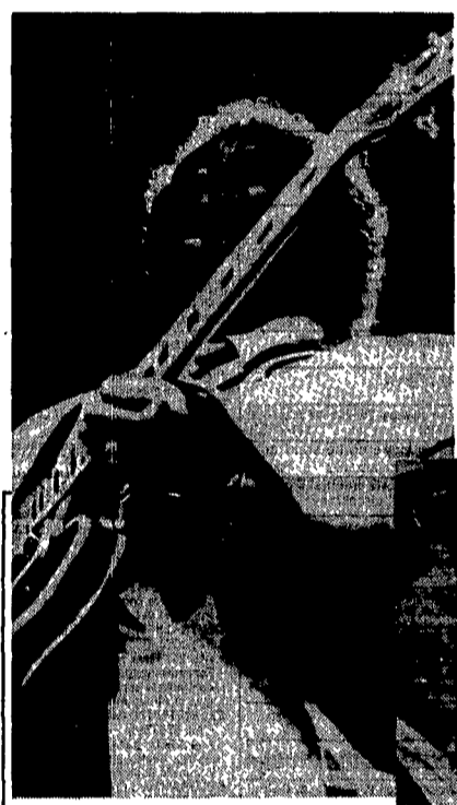
B.B. King, il «re del blues» domani in concerto al Teatro Tenda Planetaria. A destra gli A-Ha; sotto il gruppo Shamen; a sinistra Paco De Lucia in concerto stasera al Teatro Tenda Planetaria.

munque, per scelta di temi e interpreti, vanno visti a causa della loro unicità nel panorama cinematografico attuale. Bravi attori come Abraham, Aiello e Williams rendono automaticamente un prodotto come questo più vedibile e più vendibile, specie se diretti bene come Squitieri sa fare. I delitti del rosario di Fred Walton, con Donald Sutherland e Charles Durning. Non è certo l'arrivo di questo atteso thriller per la prossima settimana; non va però perso di vista per due motivi: è autore quel Fred Walton che ha firmato uno dei più interessanti «neri americani» degli ultimi anni (Quando chiamano uno sconosciuto) e ne è interprete un Sutherland in stato di grazia. L'attore canadese è molto convincente in questa parte dai risvolti hitchcockiani in cui un prete cattolico non può intervenire contro un assassino che gli si è velato in confessionale.